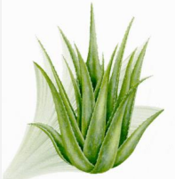
Aloe vera Analysis

Aporta valor añadido a la industria biotecnológica canaria.