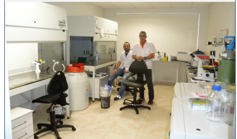
Cell culture laboratory